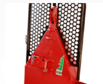
magas és alacsony behúzási pontok