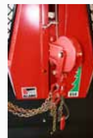
állítható behúzási pont