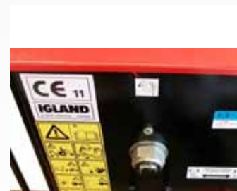
anya a tengelykapcsoló feszítéséhez