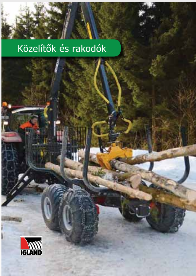
Közeltők és rakodók