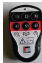
6 csatornás rádió távirányító (opció)