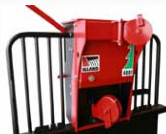
felső görgő a magas behúzási ponthoz(opció)