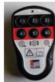
6 csatornás rádió távirányító

Cikkszám LEÍRÁS 300491 IGLAND 5002 Pento TL