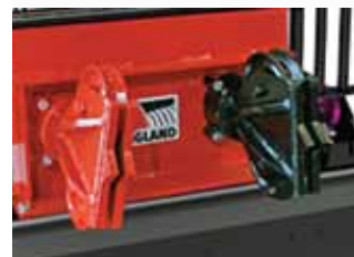
kettős csigás propeller port