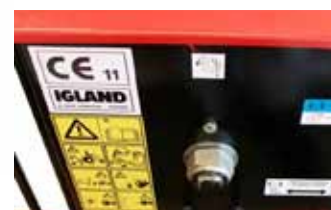
anya a tengelykapcsoló feszítéséhez