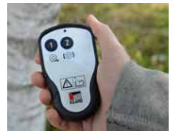
2 csatornás rádió távirányító (opció)