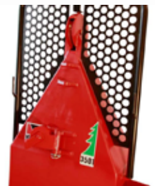
magas és alacsony behúzási pontok