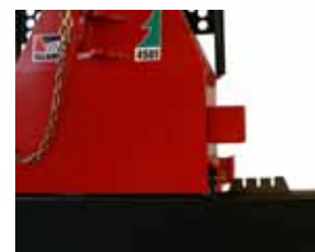
lánctartó és kötélvágó él a támasztólapon