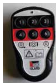
6 csatornás rádió távirányító