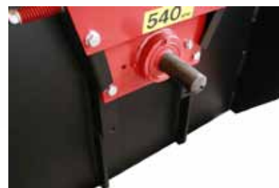
behajtótengely állítható magassággal