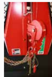
állítható behúzási pont

60 kN ( 6,0 tonna) 26 kN ( 2,6 tonna) 1 128m/10mm; 103m/11mm; 85m/12mm 50m/11 mm 0,76 - 1,73 m/s; 0,44 - 1,00 m/s 1 : 6 ; 1:10,36 49 kW; 31 kW min. 75 kN / 7,5 tonna mechanikus, kötéllel cserélhető csúsztárcsák automata biztonsági szalagfék 3-pont 50 cm 198/173/70 390