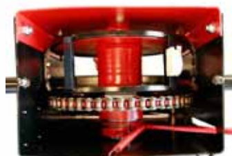
a dob belseje