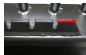
lánctartó és kötélvágó él a támasztólapon