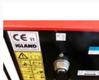
anya a tengelykapcsoló feszítéséhez

55 kN ( 5,5 tonna) 24 kN ( 2,4 tonna) 1 128m/10mm; 103m/11mm; 85m/12mm 50m/11 mm 0,76 - 1,73 m/s; 0,44 - 1,00 m/s 1 : 6 ; 1:10,36 45 kW; 28kW min. 68,75 kN / 6,875 tonna mechanikus, kötéllal kettős cserélhető csúszótárcsák automata biztonsági szalagfék 3-pont 55 cm 158/150/58 310