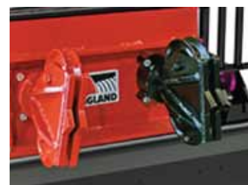
kettős csigás propeller port