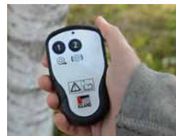
2 csatornás rádió távirányító

153500 Lassítóhajtómű (áttétel 1:10,3) 153506 Hidraulikus fék - a visszacsúsztás elkerülésére 153508 PULLMATIC rádióirányítással